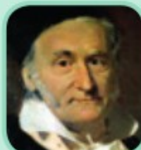
Carl Friedrich Gauss

En 1915, empezó a trabajar como matemática en la Universidad de Gotinga.